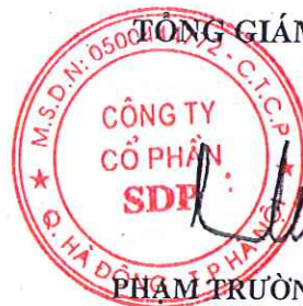
PHẠM TRƯỜNG TAM